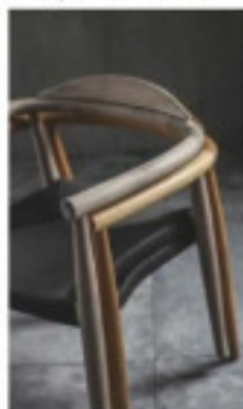
Silla Dansk (Elioster) y tarima de Cabarró Wood-Deck, ambas, de madera controlada.

AUNQUE aún no ha llegado a generalizarse en la opción de compra de los usuarios finales, los fabricantes son conscientes de su responsabilidad y exigen maderas certificadas que aseguren la sostenibilidad de sus materiales. Pero no todos los certificados son iguales, y según los expertos, el sello FSC (Forest Stewardship Council, consejo de administración forestal) es el que ofrece mayores garantías. Gonzalo Anguita, director ejecutivo de FSC en España, señala los principios y criterios internacionales en los que se basa la certificación de la gestión forestal. Estos implican que no hay deforestación ni conversión a otros usos; el mantenimiento de la biodiversidad y de los procesos ecológicos; la protección de los derechos de los trabajadores, comunidades y grupos indígenas, y la viabilidad económica de la gestión forestal. Estos requisitos deben ser cumplidos por los propietarios, los gestores y las industrias forestales para poder obtener el certificado de gestión forestal.