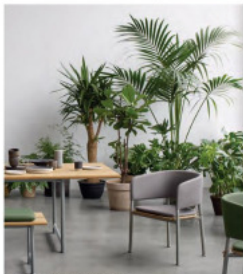
Gloster, collection Atmosphère.