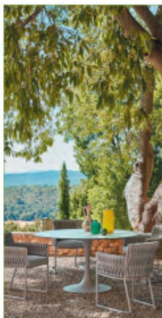
Table Korol, Sifas.

« Parmi nos créations, je retiens cette année la nouvelle fonction du canapé Koroly, qui est également une chaise longue, permettant de répondre à des problèmes de gain de place avec cette solution, et la table Korol, qui apporte une modernité qui n'existait pas pour des tables rondes d'extérieur. La tendance forte de la prochaine saison est ce nouveau tissage réalisé en polyester. On avait entrevu quelques créations en 2017, mais on peut affirmer aujourd'hui que ce matériau représente le futur des nouvelles créations. Il permet aux designers de s'exprimer avec toutes les formes possibles, il apporte un confort idéal à l'utilisateur, et sa technologie lui confère une durabilité optimale à l'extérieur. »